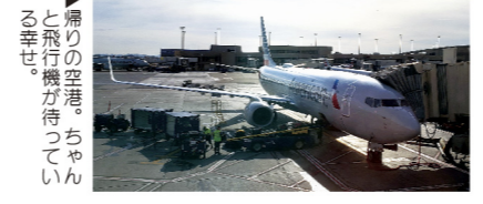
▲広いダラス空港。お巡りさんは自転車移動。 ▲やっと到着したシンシナティは、もうすっかり夜。 ▲滞りの空港。ちゃんと飛行機が待っている幸せ。