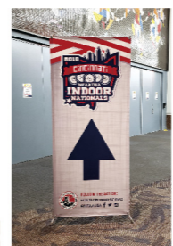
▲旅のもうひとつの目的はインドアの大会です

時計が1時間遅れていたということ は、起きたのは9時...夕べホテルに着 いたのも21時だと思っていたけど本当 は22時...向かいのコンビニに水を買 に行つたのは23時近かつたのが。一人 で外に出るのはあまり良くなかつたか も。時差ほけ+寝ほけ頭でぐるぐる考 えながら、とりあえず時計を合わせ、 雨具を着て(外は小雨が降っています) 朝食を買いに、近くのサンドイッチ 店・サブウェイに向かいました。 サラダとトルティーヤとスー プを買うことにしたので すが...アメリカのものは ビッグサイズなので、 これで朝夕2食をまかな