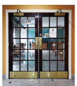
▲無情にも開められていたドア

夕べは遅く到着したの で今朝は少しのんびり、 8時に起床。着替えて朝 食に降りて行く。朝食コーナーには 「Closed (終了)」の札が。えー！ まだ9時前なのに中に人がいるのを見 つけてドアを開けようとしたが、 やっぱりカギが掛かっている。ドアをガ チャガチャやっていると私に気がついて、 中の一人がカギを開けてくれました。 ホテルの制服を着たその人に「朝食は 終了？」と英語で聞くと「9時半まで だよ。」だってまだ8時...とスマー トフォンの画面を見て気づきました。 あちゃー、経由地ガラス時間のまま だった...！そつ、ダラスと、このシン シナティには1時間の時差があるので す。「OK, my mistake (私の 間違いです)」とつなだれる